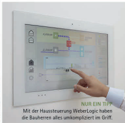
NUR EIN TIPP Mit der Haussteuerung WeberLogic haben die Bauherren alles unkompliziert im Griff.