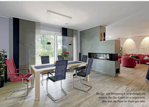
FEUERFREI Der Ess- und Wohnbereich ist großzügig und modern. Der Gas-Kamin ist so angebracht, dass man das Feuer im Sitzen gut sieht.