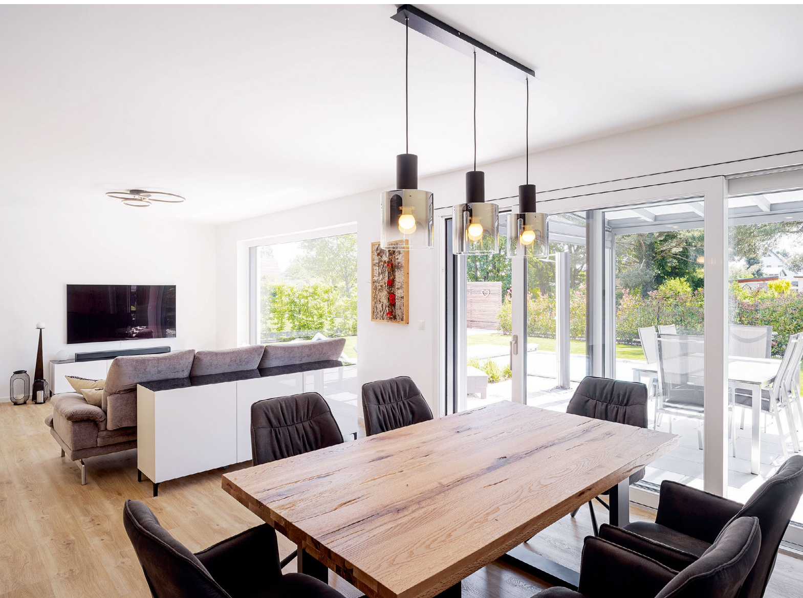
Von der Diele schweift der Blick über den offenen Wohn- und Essbereich direkt zur Terrasse und in den Garten.