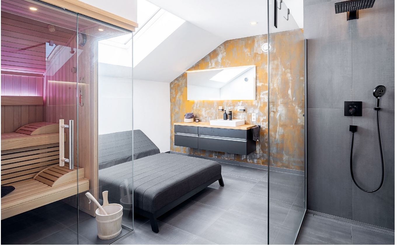
Eine Sauna, eine Liege mit Blick in den Himmel, eine bodengleiche Dusche – mehr Wellness im eigenen Bad geht wohl kaum.

Dank des Stromspeichers können wir den Sonnenstrom auch in den Abend- und Nachtstunden nutzen