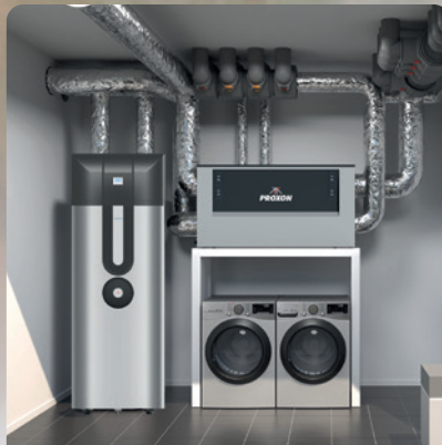
Kühlfunktion für Ihr WeberHaus