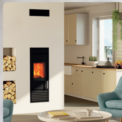
Kaminofensystem Kingfire Classico S