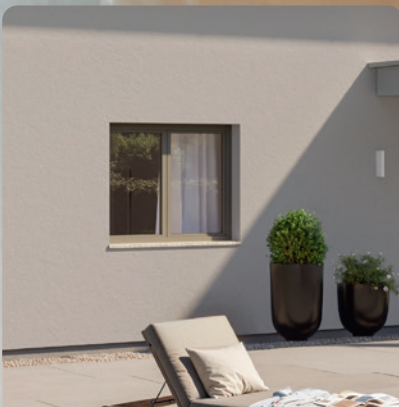
Kunststofffenster in Quarzgrau