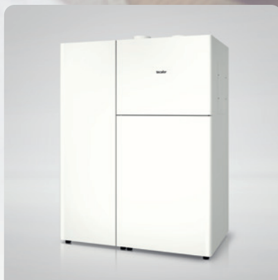
THZ Luft-Wasser- Wärmepumpe inklusive Fußbodenheizung