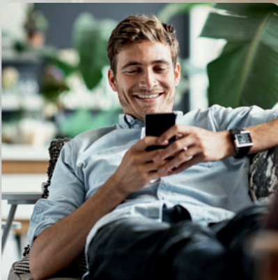
WeberLogic 2.0 für smarten Wohnkomfort