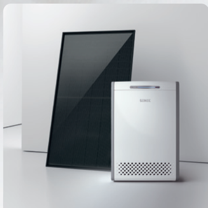
Photovoltaikanlage mit Batteriespeicher

Ihr Traumhaus ist schon perfekt? Jetzt wird es noch besser! Mit unseren Jubiläumspaketen sichern Sie sich exklusive Vorteile und hochwertige Extras.