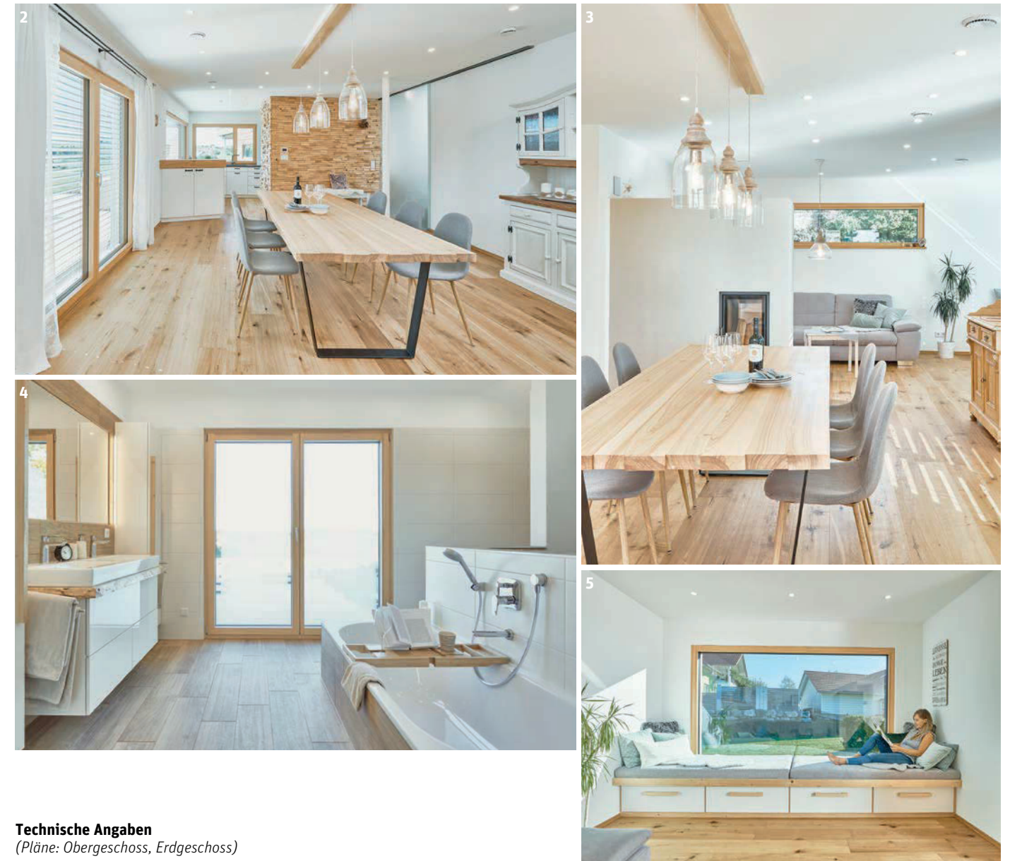
Technische Angaben (Pläne: Obergeschoss, Erdgeschoss)

Eine Herzensangelegenheit der Bauherren ist das Energiekonzept ihres Hauses. «Wir wollten ein Eigenheim, das möglichst energieautark ist», so das Ehepaar. Da bei Häusern ein Grossteil der Wärmeenergie über die Aussenwände verloren geht, ist eine hervorragende Dämmung, wie etwa bei der Gebäudehülle ÖvoNatur Therm von Weberhaus, eine Grundvoraussetzung für ein hohes Mass an Autarkie. Zudem sorgen dreifachverglaste Fenster, eine Wohnraumlüftung und die passende Heiztechnik für eine hohe Energieeffizienz. Dank Photovoltaik-Anlage und Batteriespeicher erfüllt das Eigenheim der Familie die hohen Anforderungen eines KfW-Effizienzhauses 40 Plus. Das Niedrigenergiehaus erhält somit die höchste deutsche Förderstufe für energieeffiziente Häuser. (pd/el)